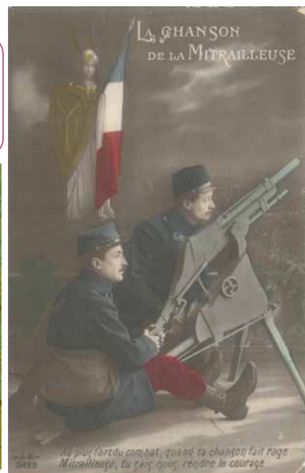
Carte postale sur laquelle est indiquée La Chanson de la Mitraillette : « Au plus fort du combat, quand la chanson fait rage, Mitraillette, tu sais nous rendre le courage »