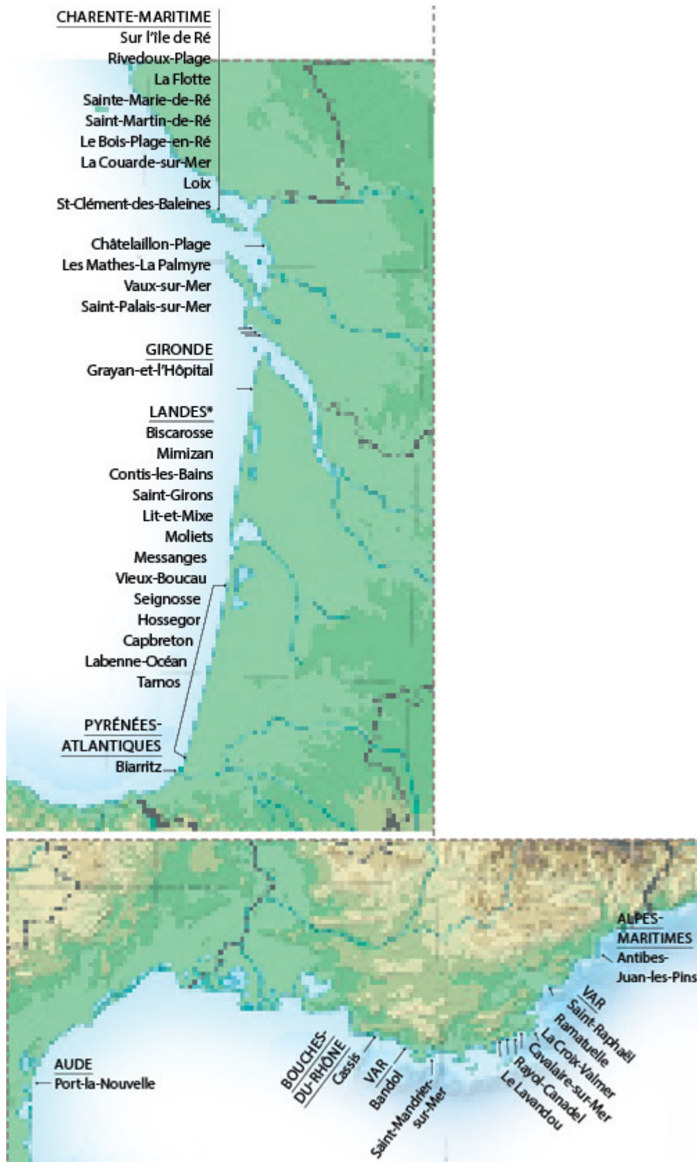
Zoom sur trois régions